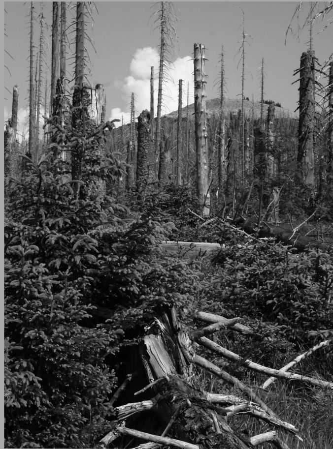
Natürliche Waldentwicklung am Lusen

Der Radweg von Waldhäuser bis zur Martinsklause sowie der Wanderweg Grünes Dreieck/Luchs - vom Lusenparkplatz / Waldhausreihe bis zur Glasarche - sind im Sommerhalbjahr für Kinderwagen und Rollstuhl geeignet.