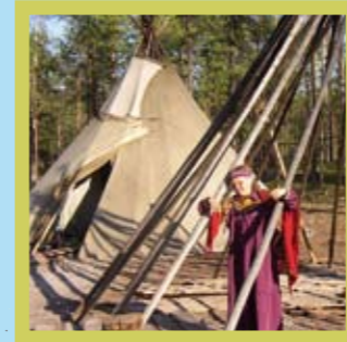
Russland – Sibirische Indigenengebiete Unterkunft: Chum-Zelt Partner: Indigene Gruppe der Khanty und Mansi Anknüpfungspunkte: z.B. Ölförderung in Naturgebieten, Zusammenhänge mit unseren Konsumgewohnheiten, globale Verflechtungen