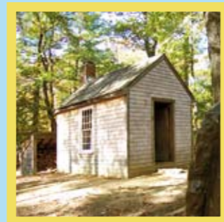
USA – Wildniscamp Unterkunft: Amerikaner Organisator: Amerikaner Anknüpfungspunkte: z.B. Amerikaner