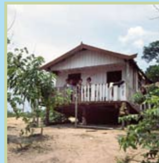
Brasilien – Amazonasregion / Mamirauá Schutzgebiet Unterkunft: Caboclo Hütte aus Holz auf Plattform, mit Ofen zum Rösten von Maniok-Mehl Partner: Schutzgebietsverwaltung, GTZ Projekt Anknüpfungspunkte: z.B. Ressourcennutzung im tropischen Regenwald, Biopiraterie, traditionelles Wissen