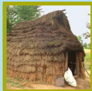
Chile – Conquillo Nationalpark Unterkunft: Chilienische Ruka, Hütte aus Holz mit Schilfdach Partner: Instituto Indigena; CONAF Anknüpfungspunkte: z.B. Indigene Mapuche-Kultur, Naturerhalt in Umbruchsländern