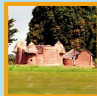
Benin – Nationalpark und Biosphärenreservat Pendjari Unterkunft: kleine Wohnanlage mit west-afrikanischen Lehmhütten Partner: GTZ Projekt "Schutz und Management der natürlichen Ressourcen" Anknüpfungspunkte: z.B. Jagdtourismus und Wildtierzucht für Naturschutz und Entwicklung