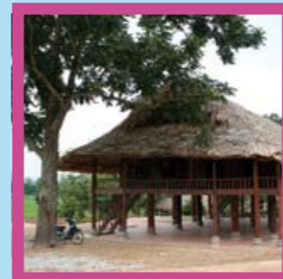
Vietnam – Tam Dao Nationalpark Unterkunft: Vietnamesisches Langhaus auf Pfosten Partner: GTZ Projekt "Bufferzone Management" Anknüpfungspunkte: z.B. Schutzgebietsmanagement bei hohem Besiedlungsdruck, Verlust von Artenvielfalt und Lebensräumen durch Meeresspiegelanstieg (Klimawandel)