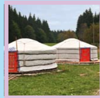
Mongolei – Khan Khentee Wildnisgebiet Unterkunft: Mongolisches Ger (Jurte) Partner: GTZ Projekt "Schutz und nachhaltige Bewirtschaftung natürlicher Ressourcen" Anknüpfungspunkte: z.B. Nomadismus, Lebensstilfragen, strategischer Naturschutz