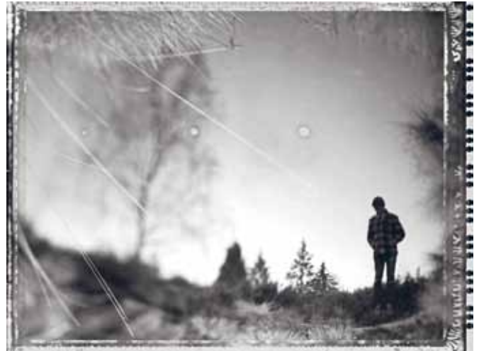
It Shows How It Is

Kalous Bilder sind unmittelbar und einzigartig.